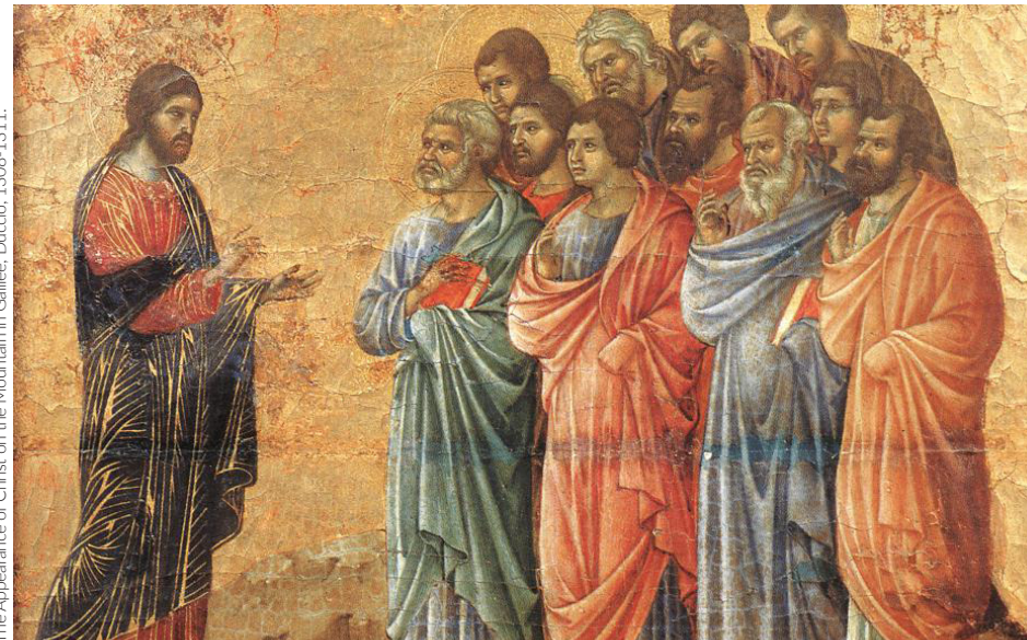
The Appearance of Christ on the Mountain in Galilee, Duccio, 1308-1311.