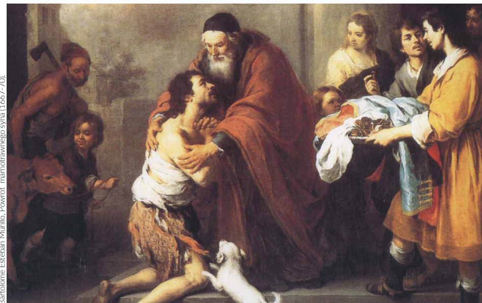
Bartolome Esteban Murillo, Powrót marnotrawnego syna (1667-70).