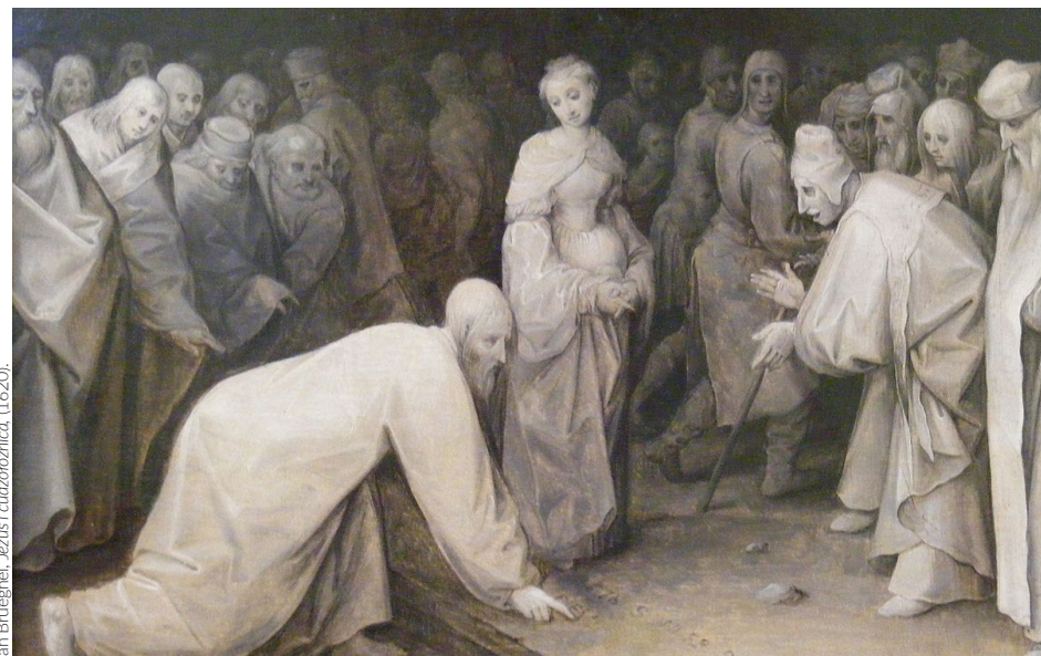
Jan Brueghel, Jezus i cudzołożnica, (1620).