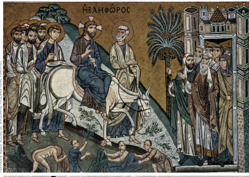
fotografia: wjazd Jezusa do Jerozolimy, mozaika XIII w. Palestyna.