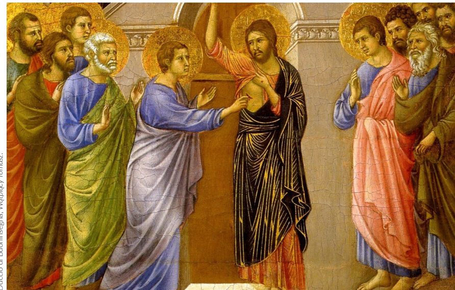
Duccio di Buoninsegna, Wątpący Tomasz.