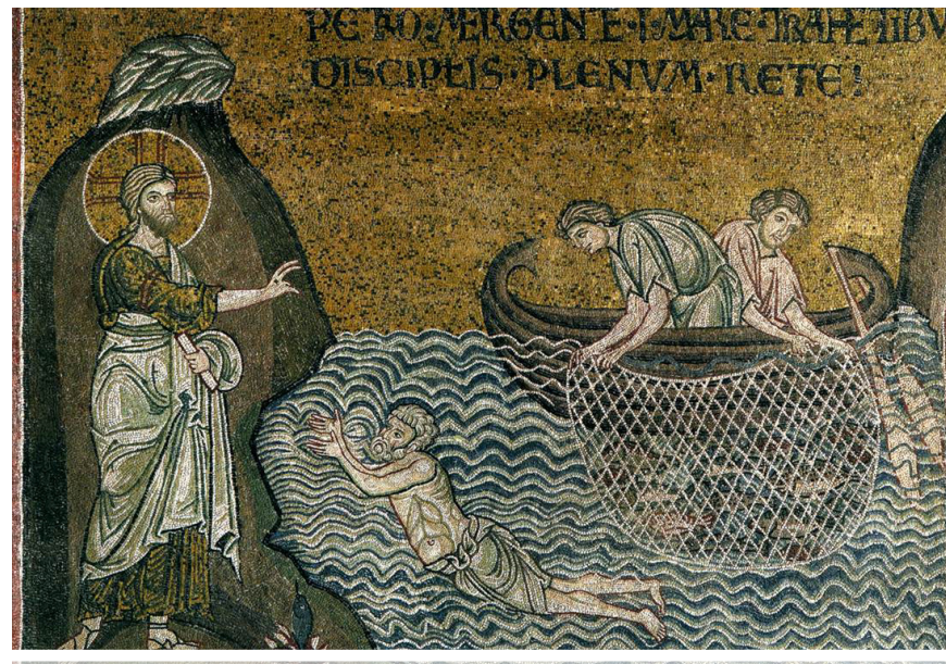
Jezus na jeziorze Tyberiadzkim, Mosaika, Sycyflia, XII w.