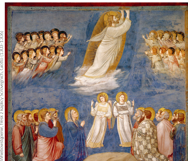
Wniebowstąpienie, fresk z kaplicy Scrovegnich, Grotto (1303-1306)