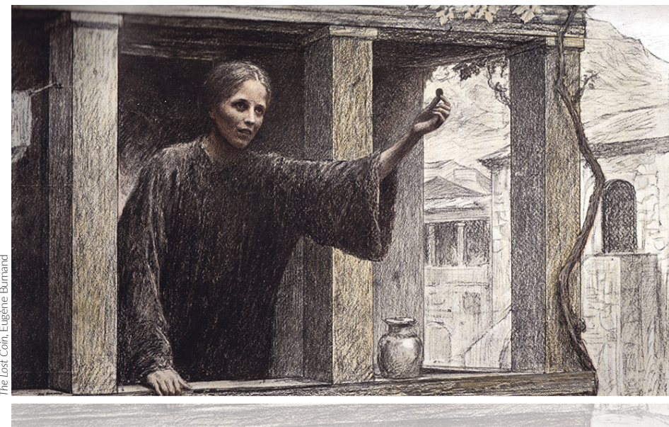
The Lost Coin, Eugène Burnand