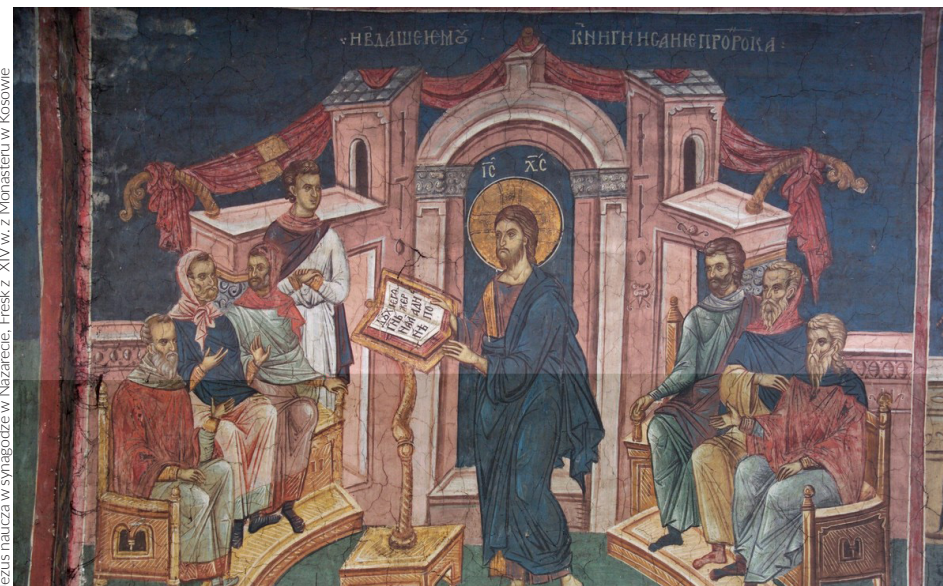
Jezus naucza w synagodze w Nazarecie. Fresk z XIV w. z Monasteru w Kosowie