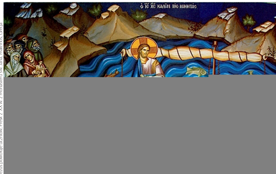
Jezus powołuje uczniów, Fresk z XX w. z Monasteru św. Jana, Makrinós, Grecja