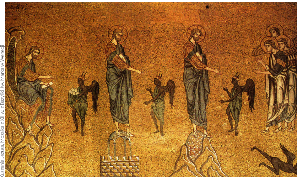
Kuszenie Jezusa. Mosaika z XII w. z Bazyliki św. Marka w Wenecji

PIERWSZA NIEDZIELA WIELKIEGO POSTU, ROK C