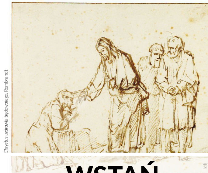
Chrystus uzdrawia trędowatego. Rembrandt